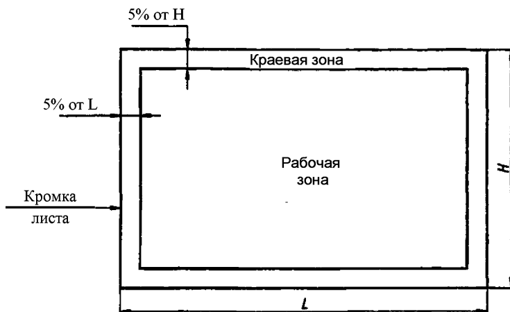
Рисунок 2 – Осматриваемые зоны стекла с покрытием конечного размера

Краевая зона составляет 5 % от длины ( L ) и 5 % от ширины ( H ) листа стекла.